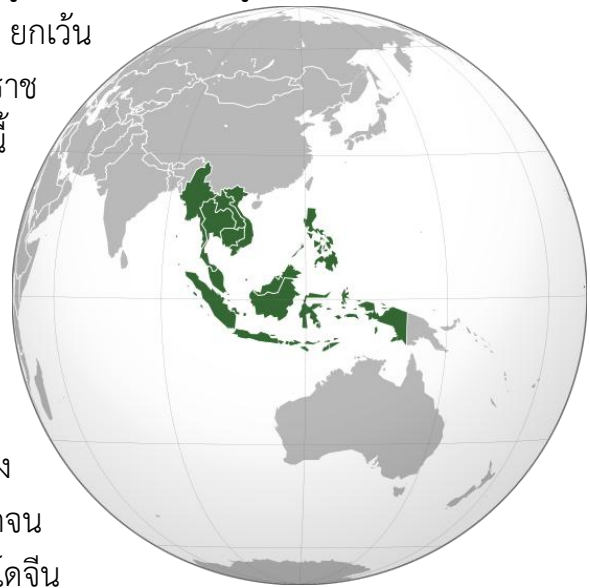
รูปที่ 1 แผนที่ประเทศในภูมิภาค เอเชียตะวันออกเฉียงใต้

ประเทศไทยเพียงประเทศเดียวเท่านั้นที่เป็นเอกราช นอกนั้นแล้วก่อนสงครามครั้งที่ 2 ประเทศเหล่านี้ ได้ตกเป็นอาณานิคมของประเทศมหาอำนาจ ได้แก่ ฝรั่งเศส อังกฤษ โปรตุเกส และสหรัฐอเมริกา ทุกประเทศต่างต่อสู้จนได้รับเอกราช จากมหาอำนาจผู้ปกครองอาณานิคมเหล่านั้น มีหลายประเทศที่หลุดพ้นจากการเป็นอาณานิคม ด้วยความราบรื่น แต่มีประเทศที่ประชาชนต้อง ต่อสู้และ สูญเสียเลือดเนื้อไปเป็นจำ นวนมากจน กลายเป็นสงครามเย็นเยื้อยาวนานคือสงครามอินโดจีน