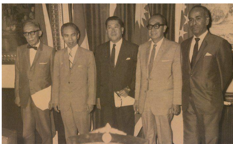
รูปที่ 3 ผู้นำ 5 ชาติเอเชียตะวันออกเฉียงใต้ร่วมกันสร้างประวัติศาสตร์ที่บ้านแหลมแท่น

วันเสาร์ที่ 5 และวันอาทิตย์ที่ 6 สิงหาคม พ.ศ. 2510 (ค.ศ. 1967) โดยการนำ ความคิดของรัฐบาลแห่งราชอาณาจักรไทย ผู้นำ 5 ชาติเอเชียตะวันออกเฉียงใต้ร่วมกัน สร้างประวัติศาสตร์ที่บ้านแหลมแท่น การประชุมสร้างประวัติศาสตร์ให้กับเอเชียตะวันออกเฉียงใต้ เริ่มต้นบ่ายวันเสาร์ที่ 5 สิงหาคม พ.ศ. 2510 หลังจาก ดร.ถนัด คอมันตร์, รัฐมนตรีตุน อับดุล ราซัค และรัฐมนตรีนาซิโซ รามอส กลับจากสนามกอล์ฟบางพระ และรัฐมนตรีราชรัตน์กลับจากพัทยา ส่วนรัฐมนตรีอาดัม มาลิก มิได้พักที่บ้านเขาสามมุขในคืนวันศุกร์ที่ 4 สิงหาคม แต่ท่านเดินทางมาจากกรุงเทพฯ ตรงสู่บ้านแหลมแท่นในตอนสายวันเสาร์ บรรยากาศที่บ้านแหลมแท่นบรรยายได้ว่าเป็น “Spirit of Bangsaen” หรือ “จิตวิญญาณแห่งบางแสน” อันจะนำไปสู่กำเนิดขององค์การใหม่เพื่อความร่วมมือทางเศรษฐกิจระดับภูมิภาค