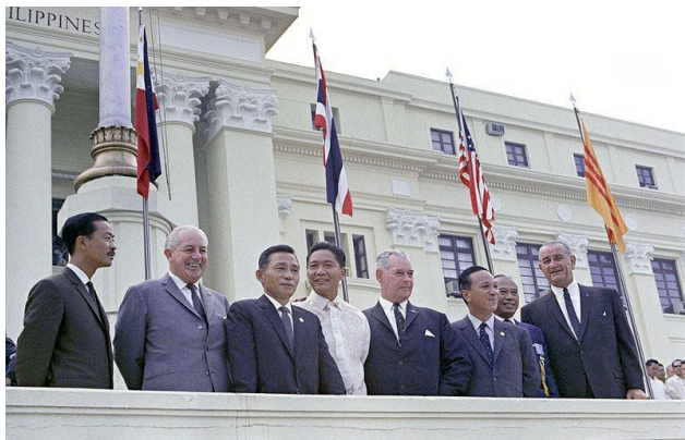
รูปที่ 2 ผู้นำของชาติสมาชิกซีโต้ ด้านหน้าอาคารรัฐสภาหลังเก่าในกรุงมะนิลา เมื่อวันที่ 24 ตุลาคม พ.ศ. 2509

“Southeast Asia Treaty Organization” หรือ “องค์การสนธิสัญญาป้องกันร่วมกันแห่งเอเชียตะวันออกเฉียงใต้” เรียกชื่อย่อว่า “SEATO” เกิดขึ้นจากการรวมตัวของสหรัฐอเมริกา , อังกฤษ , ฝรั่งเศส , ออสเตรเลีย , นิวซีแลนด์ , ปากีสถาน , ฟิลิปปินส์และราชอาณาจักรไทย ด้วยความหวั่นเกรงภัยคุกคามจากประเทศที่พยายามเผยแพร่ลัทธิทางการเมืองแบบสังคมนิยมคอมมิวนิสต์ นั่นคือภัยจากจีนและสหภาพโซเวียต (รัสเซีย) รวมทั้งกลุ่มขบวนการทางการเมืองในประเทศที่ได้รับอิทธิพลและการสนับสนุนจากมหาอำนาจฝ่ายซ้าย SEATO (ภาษาไทยใช้ตัวย่อ “ส.ป.อ.”) เกิดเมื่อปี ค.ศ. 1955 (พ.ศ. 2498) เริ่มมีปัญหากันเองในหมู่ชาติสมาชิก หลังเริ่มภาคีในทศวรรษที่สองและในที่สุดก็สลายตัวจบสิ้นบทบาทอย่างเป็นทางการในปี ค.ศ. 1977 (พ.ศ. 2520)